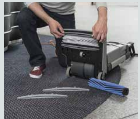
I tillegg til raskere rengjøring av harde gulv kan maskinen også rense mindre tepper og fjerne flekker ved hjelp av tilbehørsettet for tepperens. Børsten og sugenalen kan demonteres uten verktøy, så det daglige vedlikeholdet gjøres både raskt og enkelt.