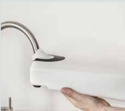
Rentvannstanken kan lett fylles med vann i enhver vask.