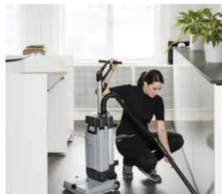
Den eksterne sugeslangen (tilbehør til Basic-versjonen) er velegnet til å suge opp væske på steder der det er vanskelig å komme til.