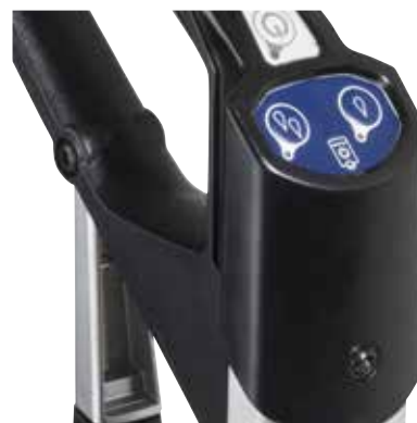
Det intuitive berøringspanelet gir deg full kontroll over gulvvaskeren, med to innstillinger for vannmengde og en varselampe som lyser når tanken er tom.