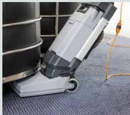
SC100 rengjør med en fri høyde på bare 25 cm.