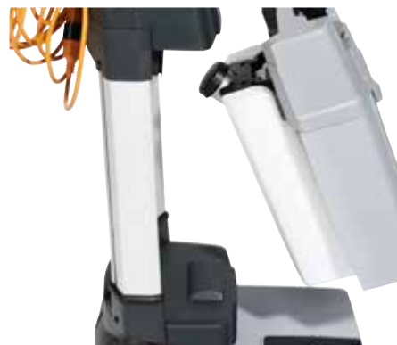
Begge tankene løftes enkelt av, og de kan lett bæres med én hånd.